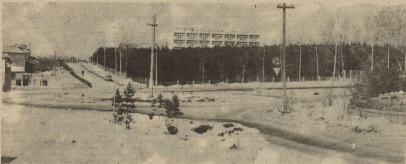
ЗИМА ПОКА НЕ СДАЕТСЯ